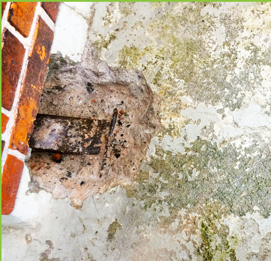
Figur 8: Ophugning til udliggerjern foretaget ind under facade til besigtigelse af jernets tilstand i området under facademuren.

Derfor kan det være en god ide at få din altan undersøgt af en fagperson, som kan vurdere, om en ophugning er påkrævet, selv om der ikke umiddelbart er synlige tegn på nedbrydning.