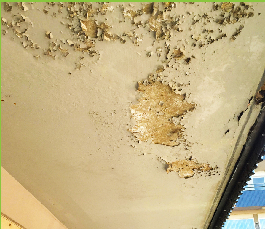
Figur 4: Afskalninger af maling og hvide udfældninger på underside af altan, hvilket indikerer, at der foregår en utilsigtet fugtpåvirkning af betonen.

kan det være indikationer på, at nedbrydning af de indstøbte udliggerjern er i gang (figur 4).