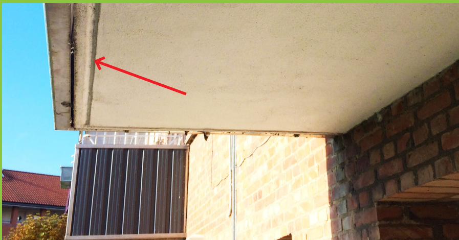
Figur 10: Drypnæse (markeret på foto) ved forkant som i dette tilfælde er "indstøbt" i betonen. Drypnæsen sørger for, at overfladevand drypper af ved altanens forkant og reducerer opfugtningen af altanens underside.