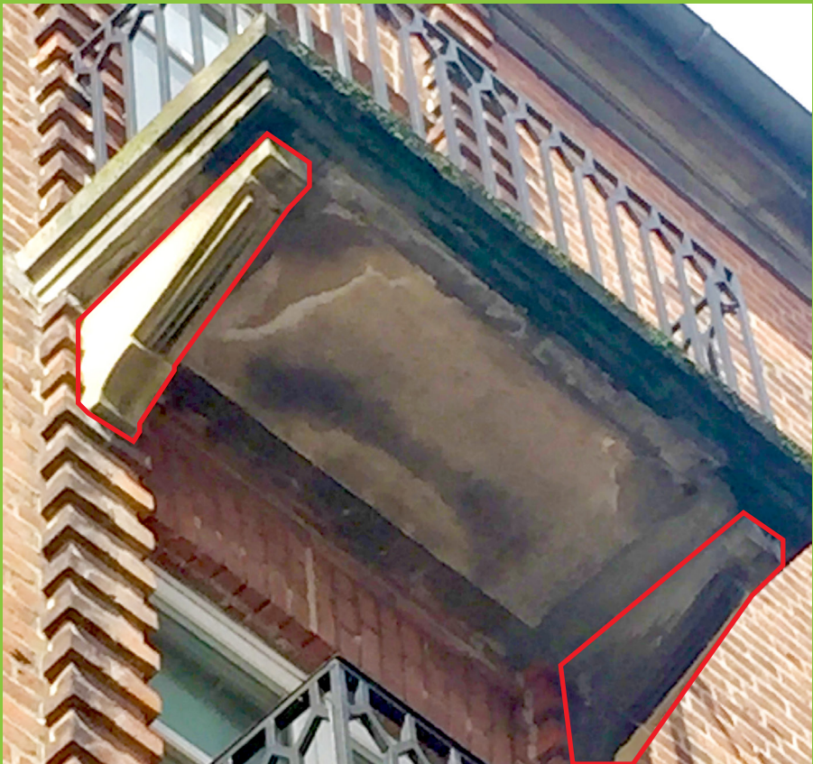
Figur 2: Altan med udliggerjern, som er udført med "pyntekonsoller" (markeret på foto), der kan give anledning til at tro, at det statiske system er anderledes end det i virkeligheden er.

Kortlægningen af en altans konstruktive udformning samt selve tilstandsvurderingen af altanen bør altid udføres af en fagperson med speciale i tilstandsvurderinger af altaner.