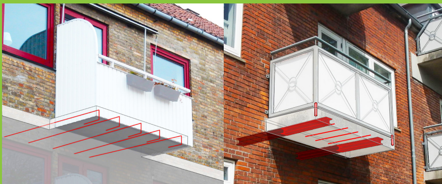
Figur 1: Den primære bærende funktion i en udkraget altanplade kan både være udført af indstøbte armeringsjern, som er med ud i altanpladen fra etagedækket (tv.) eller af omstøbte stålprofiler (udliggerjern), der er fastgjort til bjælkelaget (th.).

Betonaltaner med indstøbte udliggerjern ses typisk på bygninger fra perioden 1900-1960.