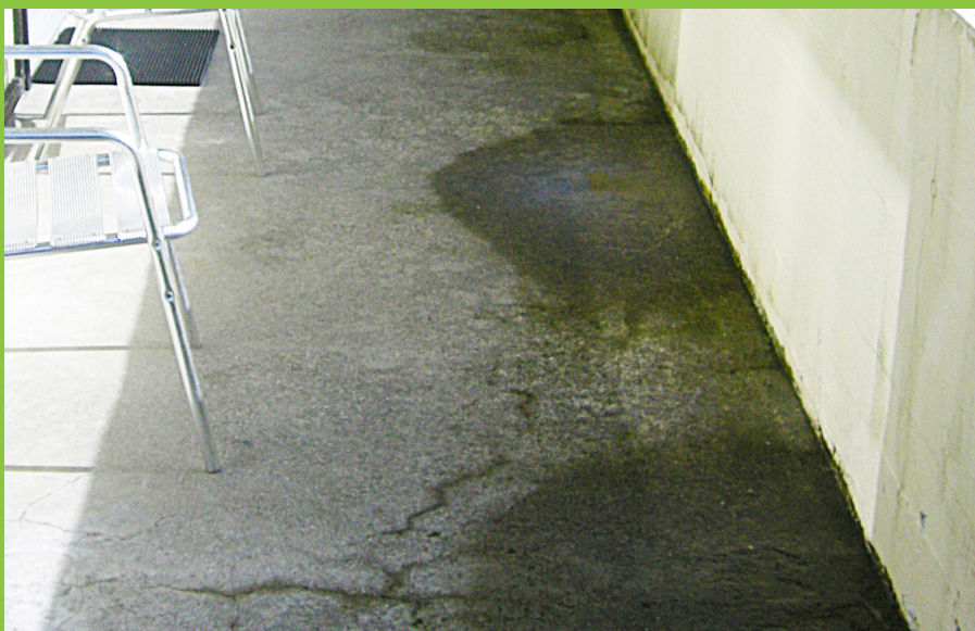
Figur 9: Altan hvor afvanding ikke foregår korrekt. I dette tilfælde opstår vandpytter mod brystning ved altanens forkant.