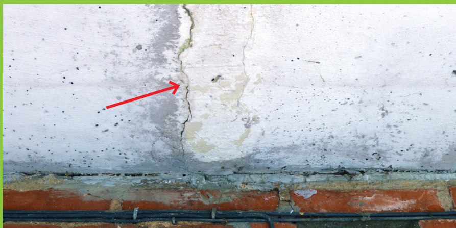
Figur 3: Altan med udliggerjern, hvor der ses revner og opbuling i undersiden, som er orienteret vinkelret på facaden. I dette tilfælde er revnen opstået som følge af korrosion på et overliggende udliggerjern. Denne type revner og udbulinger kan både optræde i altanens over- og underside afhængig af, hvor på udliggerjernet korrosionen foregår. Bemærk, at der ikke ses rødbrune udfældninger i forbindelse med revnen, selv om der foregår korrosion.

Korrosionsprodukter fra jern fylder op til 10 gange mere end jernets oprindelige størrelse. Når jern, der er indstøbt i beton, rustet, vil denne volumenforøgelse derfor medføre revner og afskalninger af betonen over jernet (figur 3). Ligeledes vil rustdannelser ofte, dog ikke altid, kunne medføre rødbrune udfældninger på betonoverfladen.