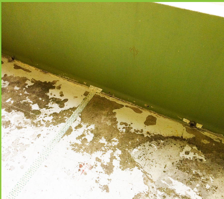
Figur 11: Udslidt/defekt belægning på overside af altan medfører øget opfugtning af betonen.

Belægninger på en altans overflader kan, udover at forhindre fugtindtrængning, også have den funktion, at de begrænser betonens reaktion med luftens CO 2 (karbonatisering), hvilket i sidste ende vil være medvirkende til at forlænge betonens levetid. En tæt membran vil derfor være medvirkende til at forlænge betonens levetid.