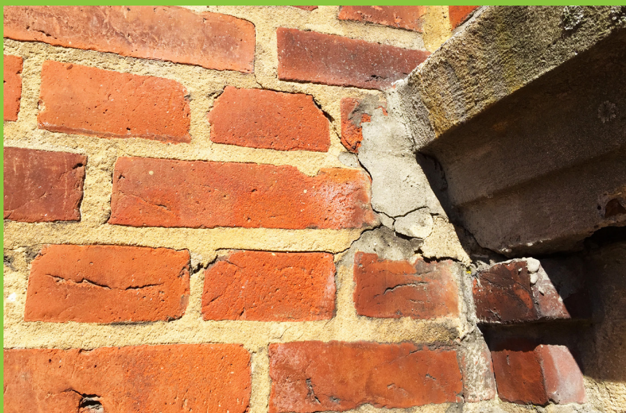
Figur 6: Revner i mørtelfuger omkring område med udliggerjern giver øget adgang for fugt til udliggerjern, hvilket kan være medvirkende til at initiere korrosion på stålprofilet.

En visuel besigtigelse bør ikke stå alene, såfremt nogen af de beskrevne skadestegn er tilstede.